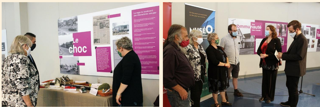
Photos : 5 @ 7 organisé le 24 septembre 2021 pour souligner l'incorporation du MRO, dans le cadre des Journées de la culture.