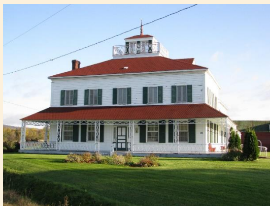
Maison George Bryson, Mansfield-et-Pontefract

Située sur la route touristique du Chemin d'eau, la Maison George-Bryson est classée en tant qu'immeuble patrimonial par le ministère de la Culture et des Communications depuis 1980. Le RPGO a retenu les services de Dominique Dufour pour la mise en place et la conception de l'exposition. Après plusieurs délais imposés par la pandémie de COVID-19 (fermeture temporaire de certains fournisseurs et de la Maison George Bryson), l'exposition est maintenant complétée et sera inaugurée au printemps 2022.