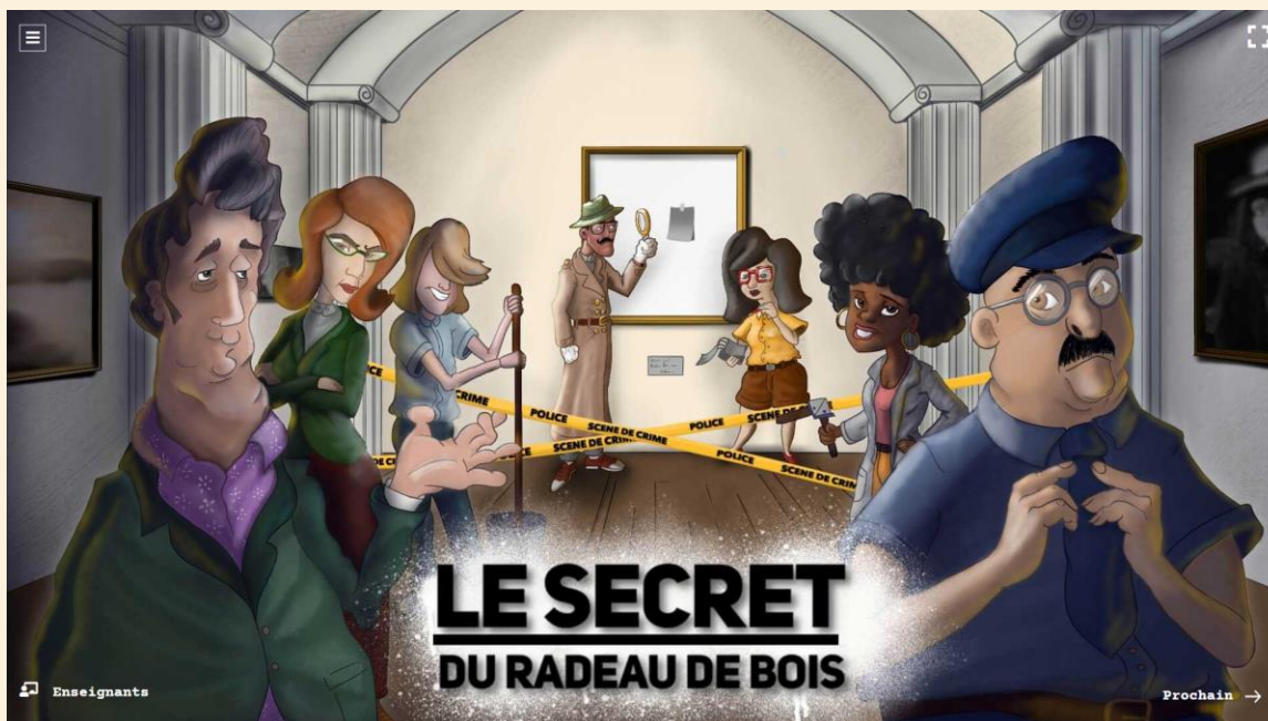
Page d'accueil du rallye « Le secret du radeau de bois », www.rallyeoutaouais.ca

Le projet a été réalisé grâce à l'entente sectorielle Culture-Éducation, financé par le gouvernement du Québec, la Ville de Gatineau, la MRC Vallée-de-la Gatineau, la MRC Pontiac, la MRC des Collines-de-l'Outaouais et la MRC Papineau.