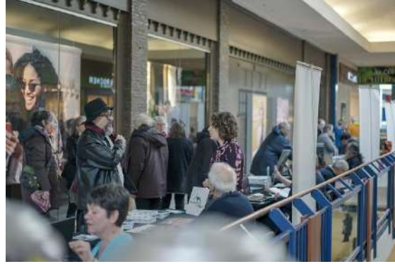
De gauche à droite, vue de l'exposition « Portrait d'un quartier disparu » et kiosques des organismes présents. En bas, table ronde animée par Julien Morissette, pour Transistor Média.