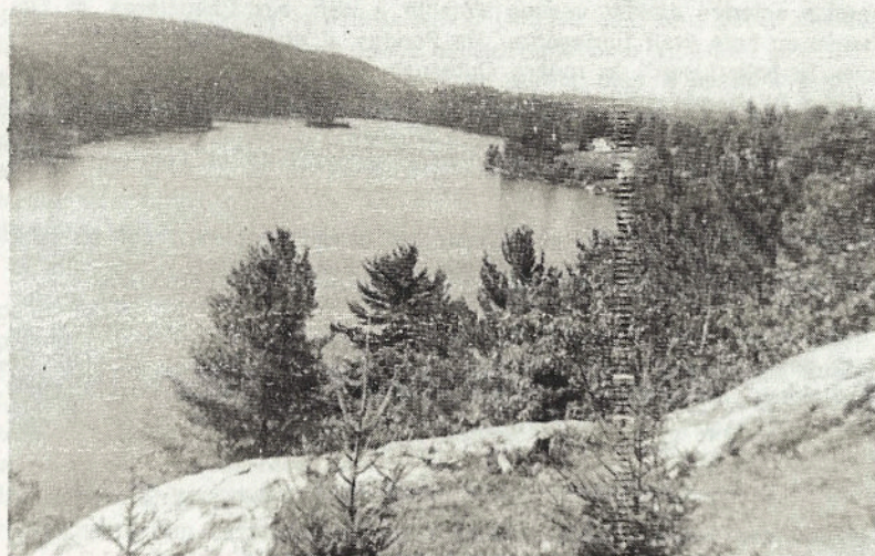
LAC MCGREGOR — Vue du côté ouest