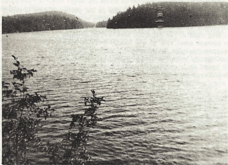
LAC MCGREGOR — Vue du côté sud-est