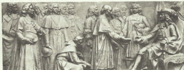
Bas-relief du monument de Mgr Laval, à Québec.

Temps total de la troisième conférence: 105 minutes.