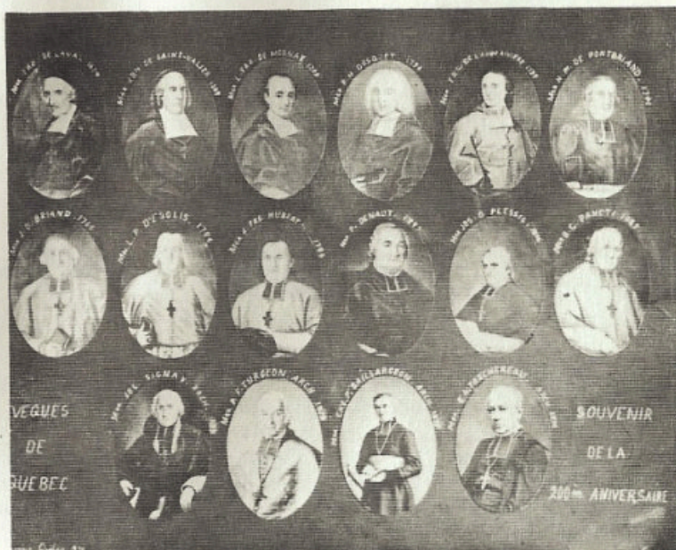
Évêques du Québec, souvenir du 200e anniversaire, 1874.

Pour couper court à cette digression qui nous entraînerait loin, et revenir à notre sujet, nous avons voulu, à la Société historique de l'ouest du Québec, à notre manière très modeste, vérifier aussi objectivement que possible, par l'histoire, si notre clergé, ce bouc émissaire commode, est responsable de tous nos maux en tant que peuple. À cette fin, nous avons essayé de réunir nos historiens les plus compétents et tenter ainsi, non pas de vider la question, — loin de là, — mais simplement de l'amorcer. Nous aurions aimé conclure notre série de conférences par un