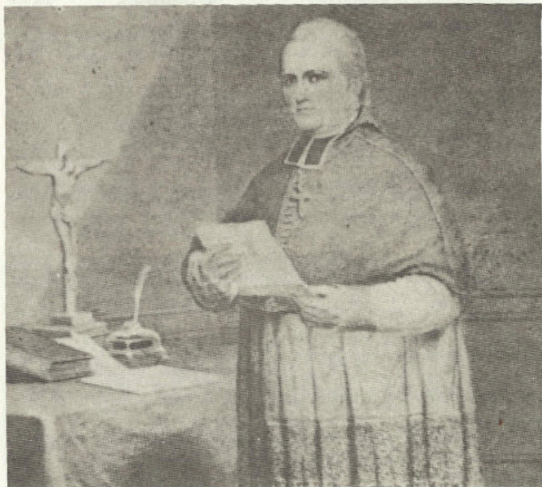
Mgr J.-Octave Plessis, onzième évêque de Québec.