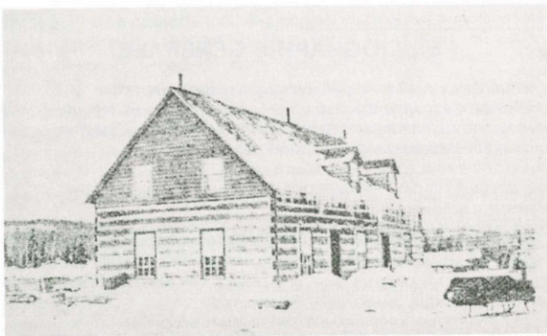
Sorte d'hôtel qui habitait les voyageurs en route vers le chantier après une journée de voyage. On pouvait s'y nourrir, se loger pour la nuit et faire reposer les chevaux.