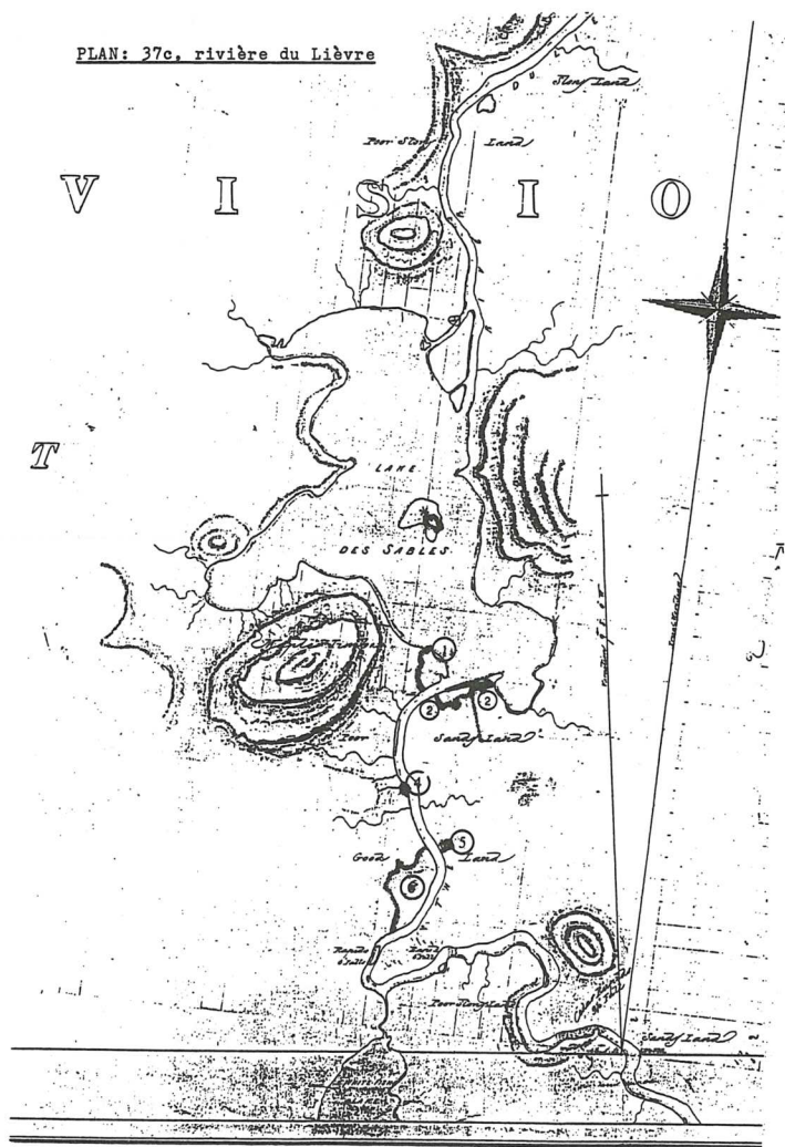
PLAN: 37c, rivière du Lièvre