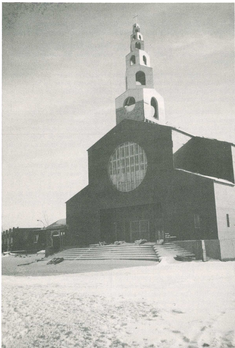
L'église Saint-Ferdinand de Fabreville, rue Esther, Laval.