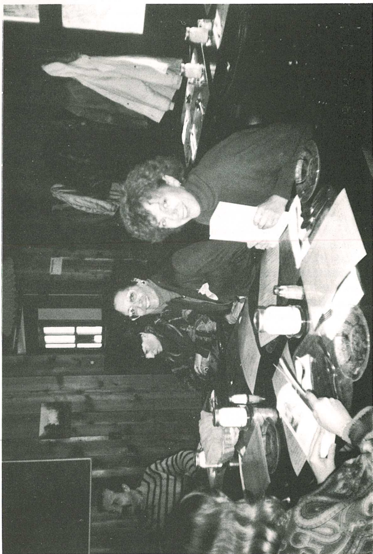
Membres de la SHOQ et de l'Association Louise-Michel à Wakefield.