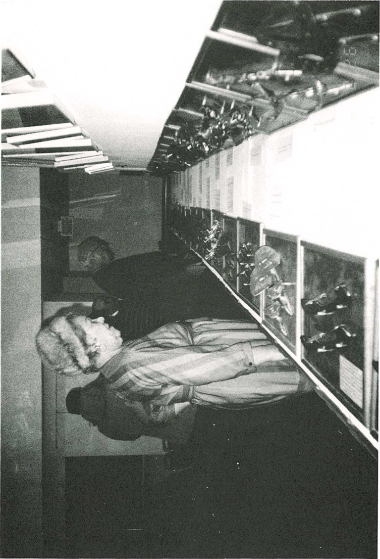
Aperçu de la collection de pains exposée durant la semaine du patrimoine.